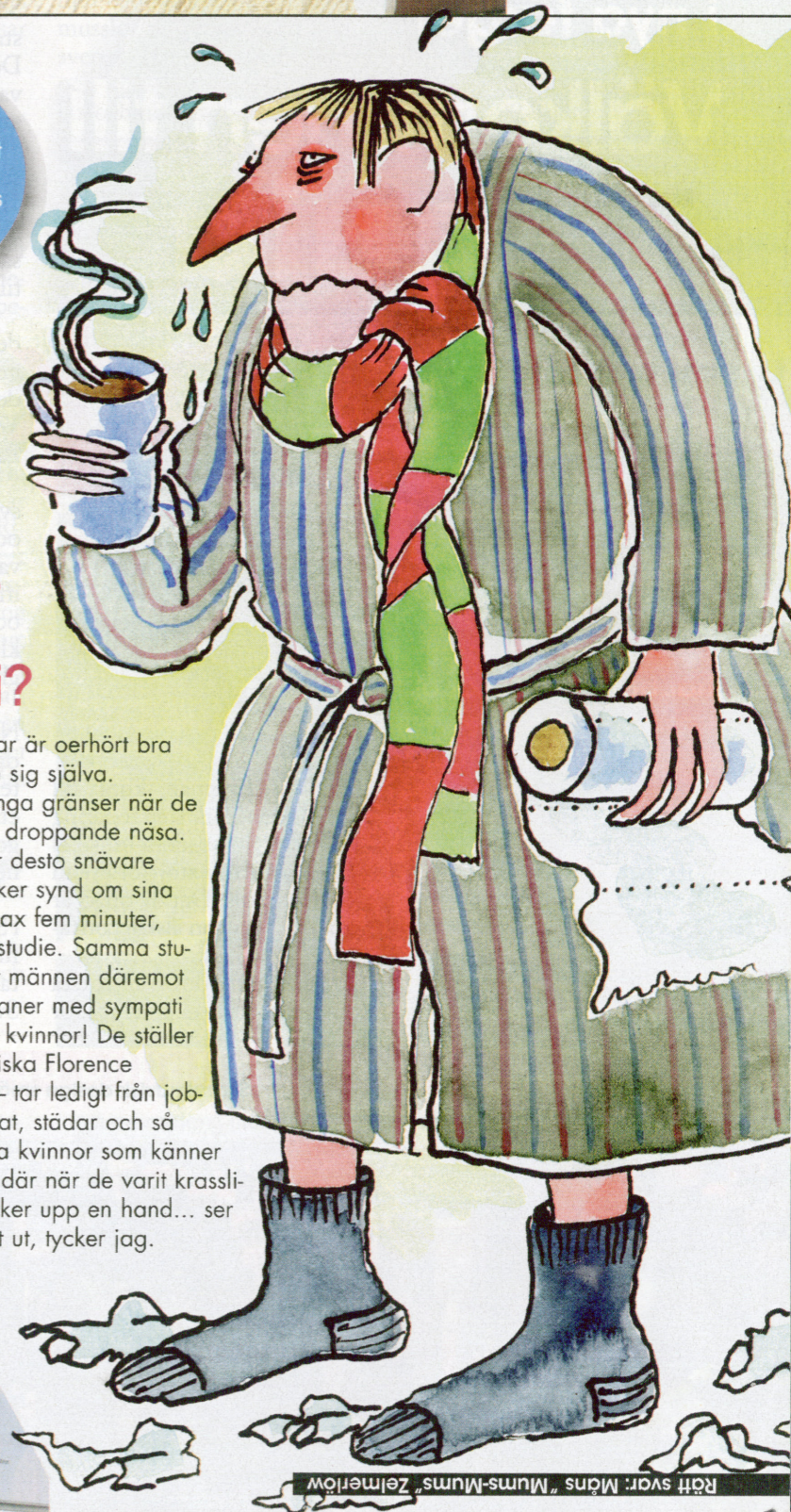
Rätt svar: Måns "Mums-Mums" Zelmelöw